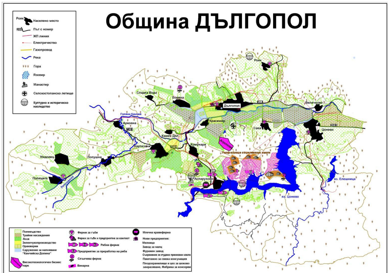
Фиг. 3: Карта на община Дългопол

Водните течения и водни площи заемат 4,9% от територията на общината. Населените места и другите урбанизирани територии са 5,0% от общата площ на Дългопол (21 989 дка). Най-малък относителен дял съответно 2,1% и 0,7% имат териториите за добив на полезни изкопаеми и за транспорт и инфраструктура. (Фиг. 2)