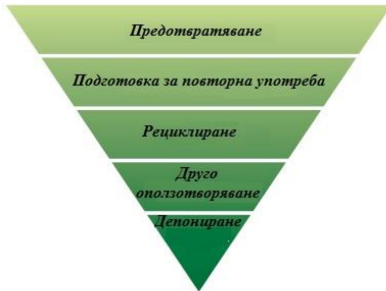
Фигура 5.1-1 Иерархия на управлението на отпадъците

Предотвратяването образуването на отпадъци означава да не възникват отпадъци, тъй като веднъж възникнал отпадъкът не изчезва, а само се променя като вещество чрез депонирането, изгарянето, рециклирането. Различните начини за третиране на отпадъците винаги са свързани с натоварване на околната среда. Дори и чрез най-съвременните технологии при изгарянето възникват емисии и/или остатъчни вещества, които трябва да се складират. Всяко депониране е намеса в природата, като при това не могат изцяло да се изключат вредни въздействия върху околната среда. В най-добрия случай отпадъците се оползотворяват, като дори и в този случай възникват натоварвания, поради употребата на енергия и вода. Поради това най-адекватното противодействие на проблемите с отпадъците са действията преди образуването на отпадъци, а именно предотвратяването тяхното образуване.