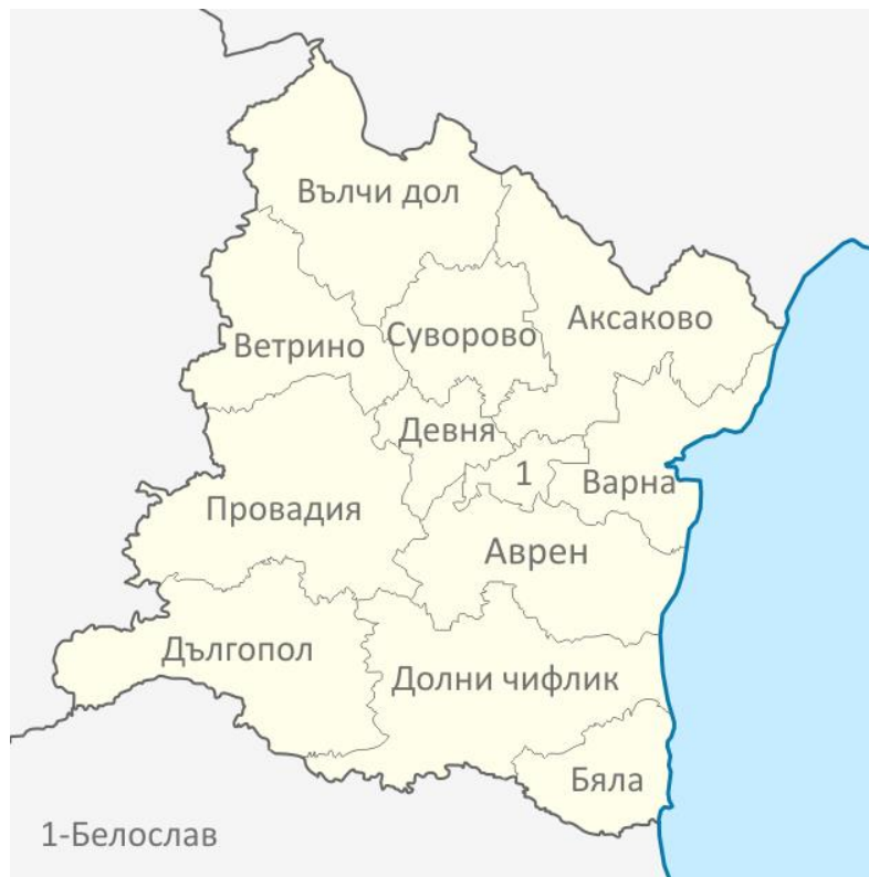
Фигура 1.1-1 Местоположение на община Дългопол

Територията на общината е 440,9 km 2 и заема 11,5 % от територията на област Варна и 3 % от територията на Североизточен район на България (СИР, NUTS 2).